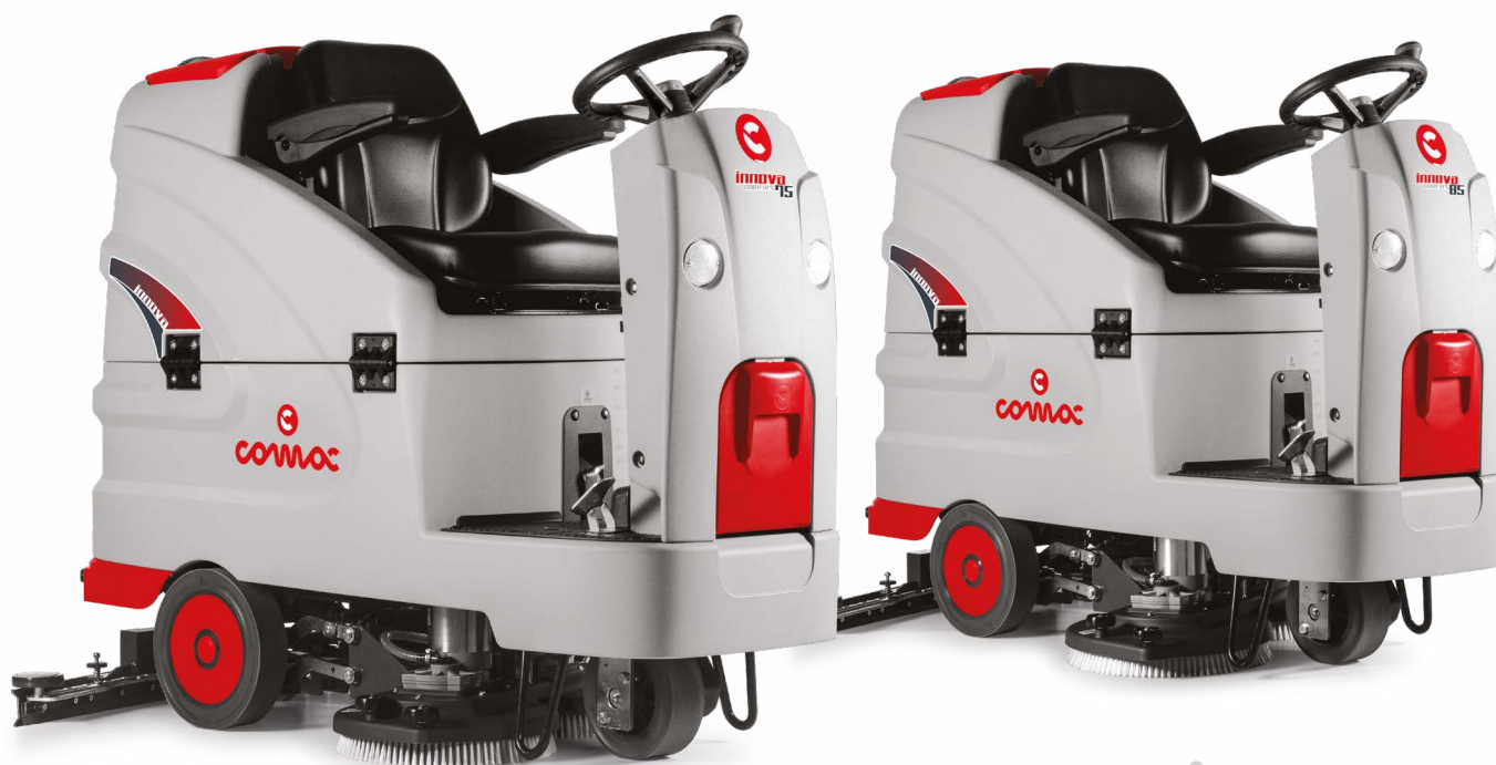
INNOVA COMFORT 75 B Versione lavante con doppia spazzola a disco Pista di lavoro: 750 mm