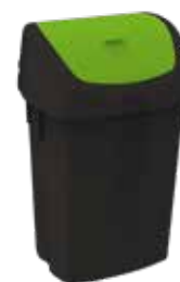
BLACK IS GREEN™ plastica riciclata