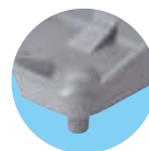
PIEDINO (SOLO PER ETA 1)