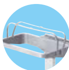
PORTASACCO 120 LT. CON BLOCCASACCO E COPERCHIO