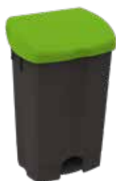
BLACK IS GREEN™ plastica riciclata