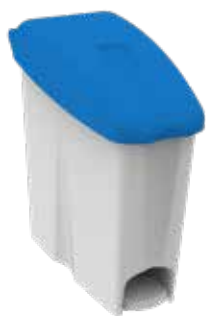
STD plastica standard