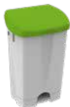
STD plastica standard