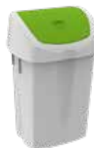
STD plastica standard