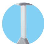
PIANTONE IN ALLUMINIO