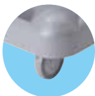
RUOTE Ø 80 MM (SOLO PER BETA 1)