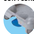
MECCANISMO APERTURA COPERCHIO CON PEDALE