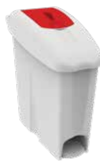
STD plastica standard