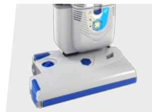
RX eF 380e