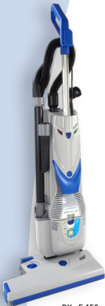
RX eF 450e