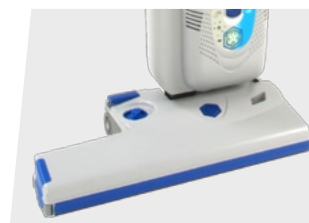
RX eF 500e